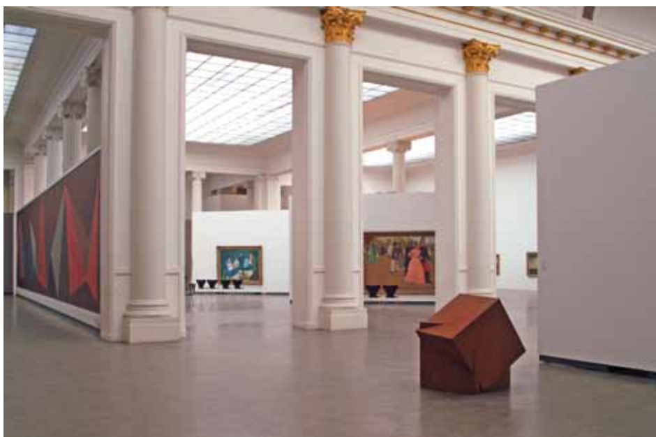
© Musée d'Art moderne et Contemporain de la Ville de Liège.