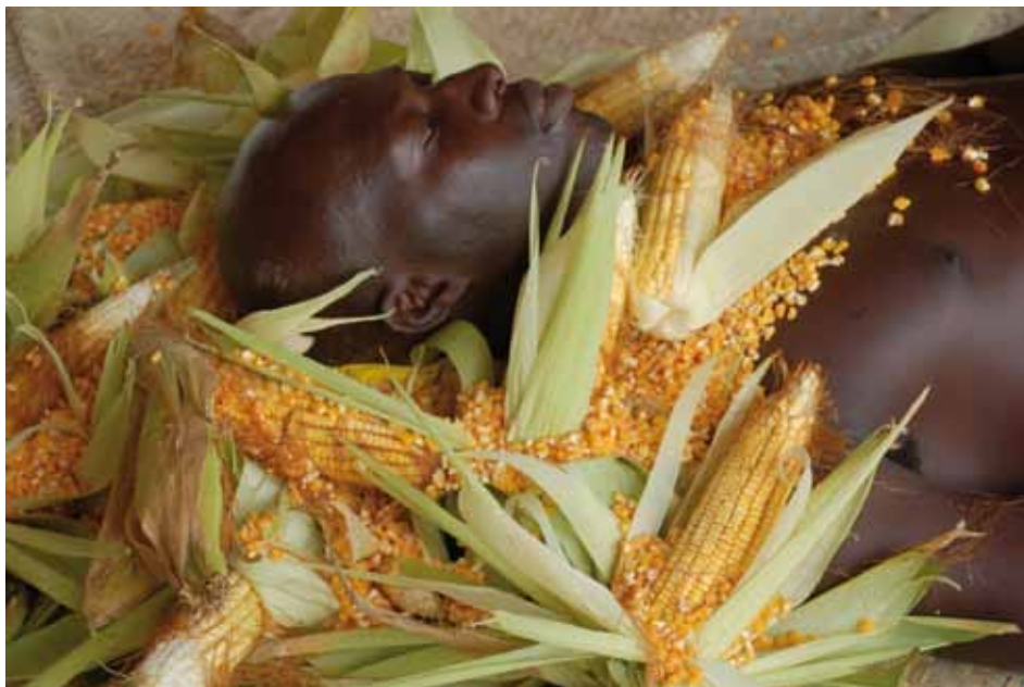
Ayrson Heráclito, Oxossi © Ayrson Heráclito