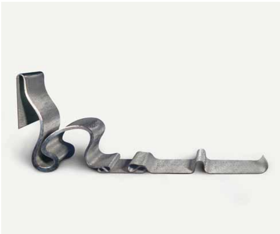
Ron ARAD, Parpadelle, 1992, FNAC 94412, Centre national des arts plastiques © Ron Arad / CNAP / photo : galerie Ethik, Marseille