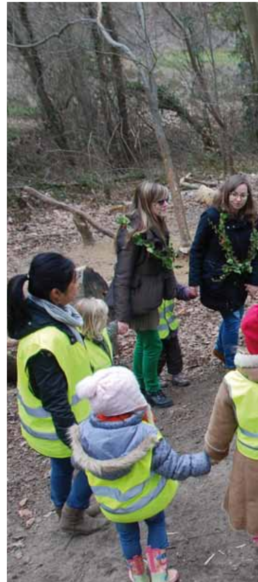
Les élèves de