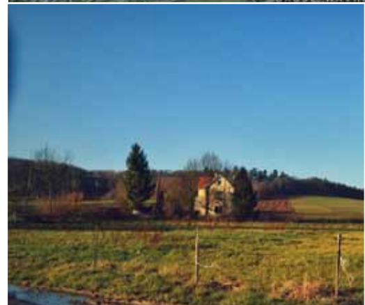
Le contournement nord de Wavre reliera Gastuche au zoning nord, à