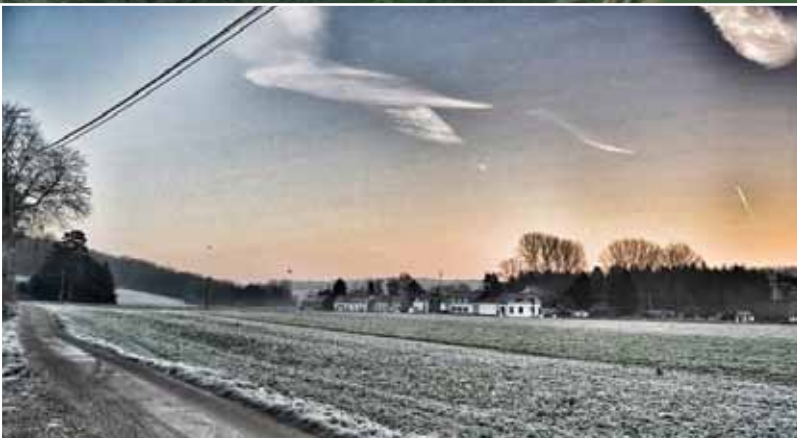
travers champs.