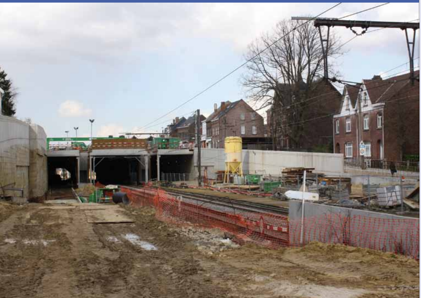
L'aménagement d'une dalle de 120 m de long au-dessus des voies permettra de créer une nouvelle place publique dans le centre de Rixensart.