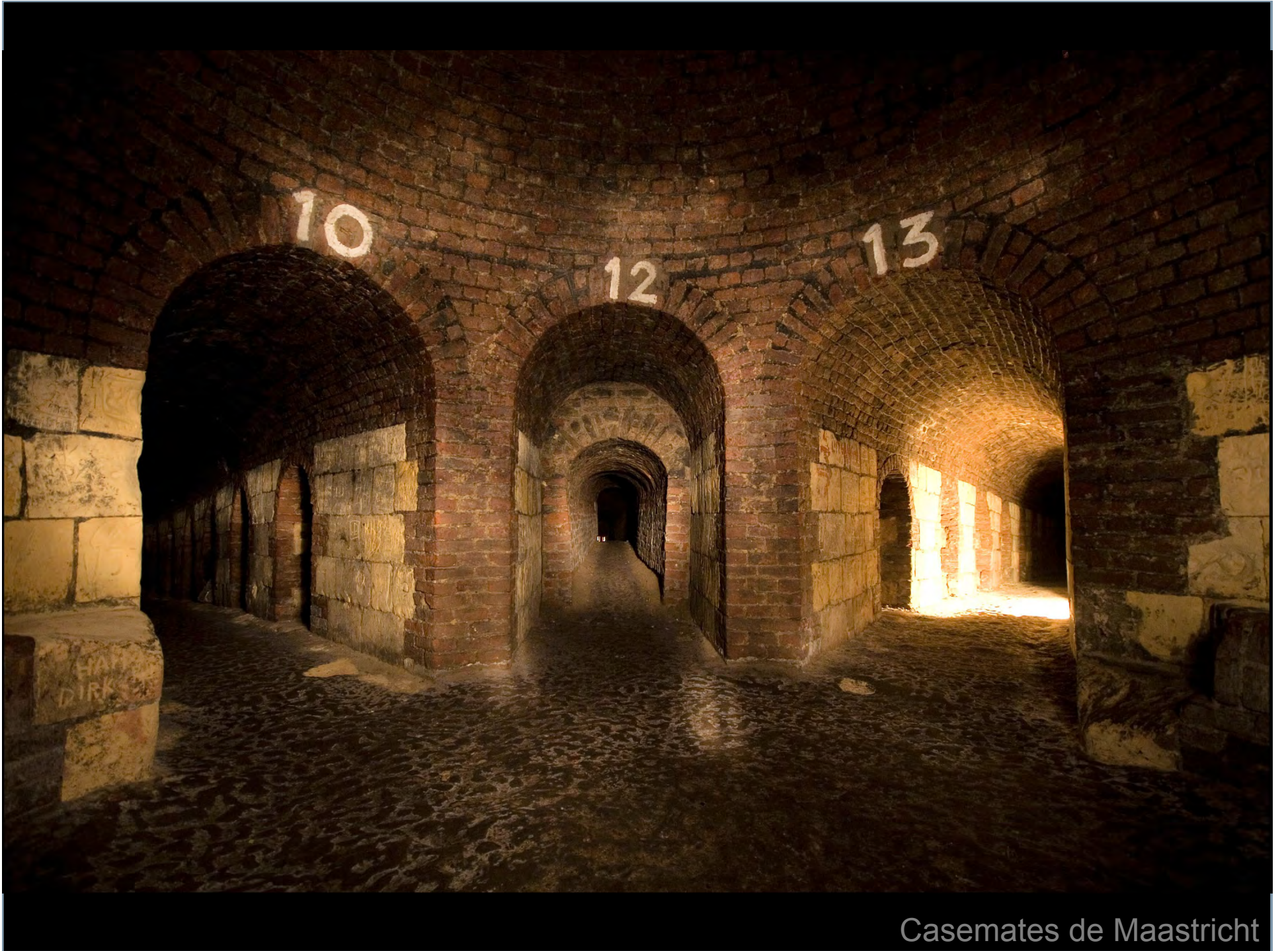
Casemates de Maastricht