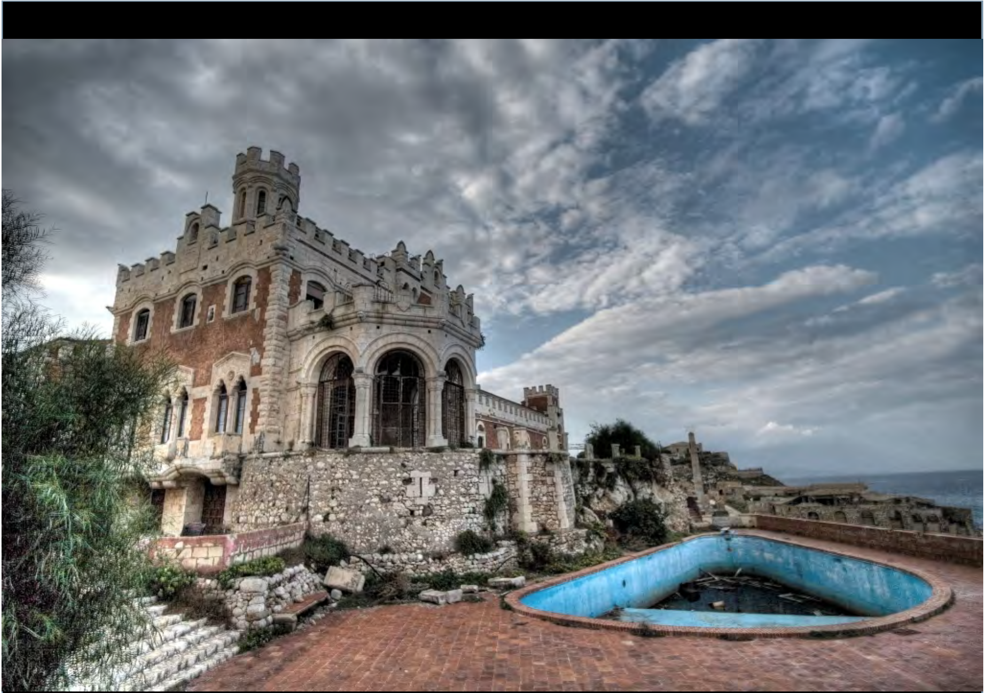
Château de Portopalo, sicile