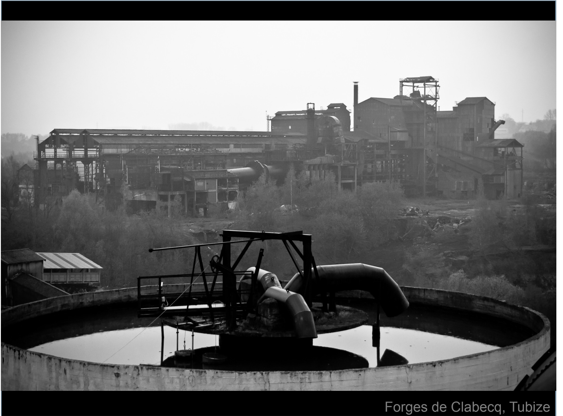
Forges de Clabecq, Tubize