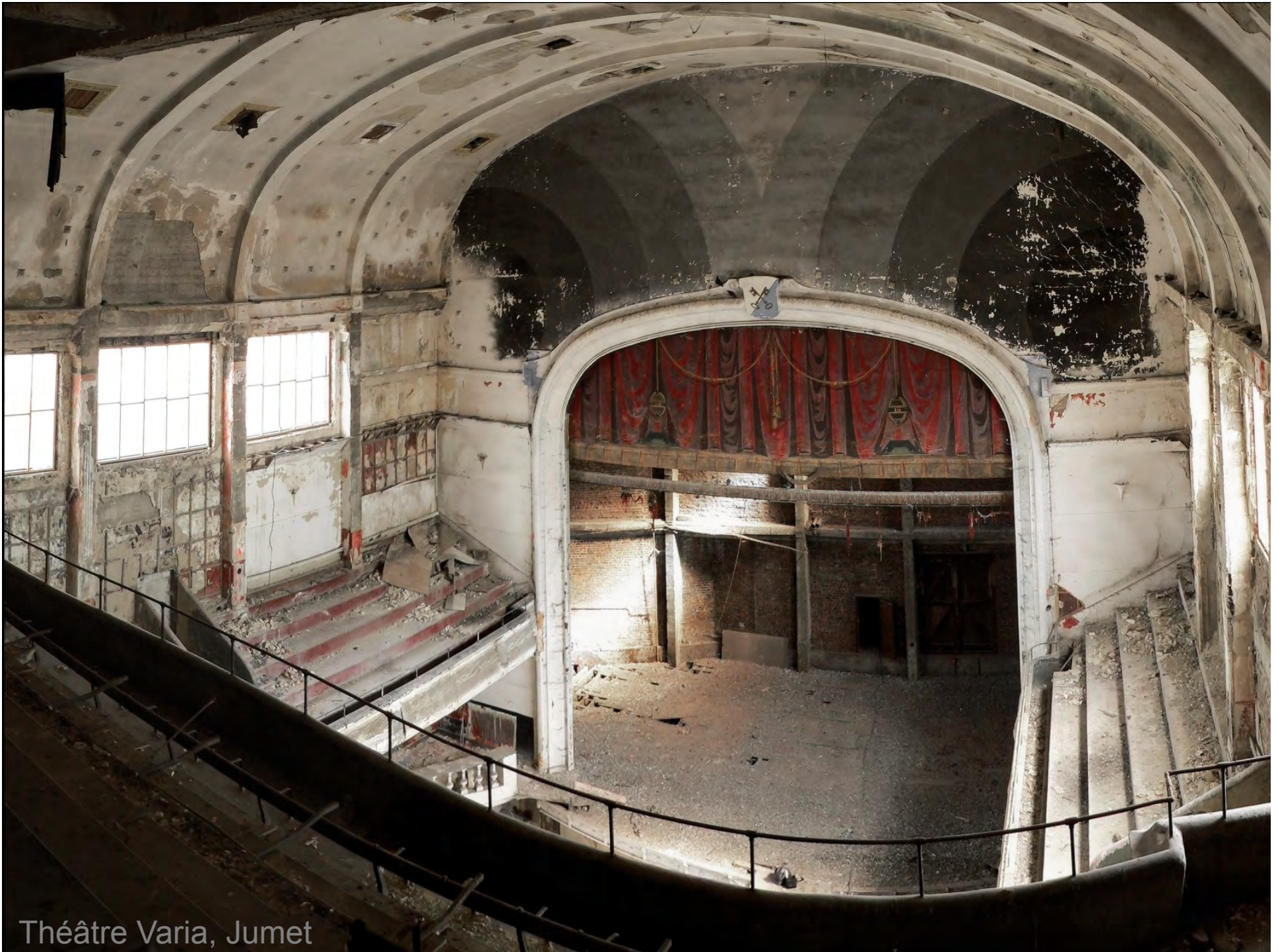
Théâtre Varia, Jumet