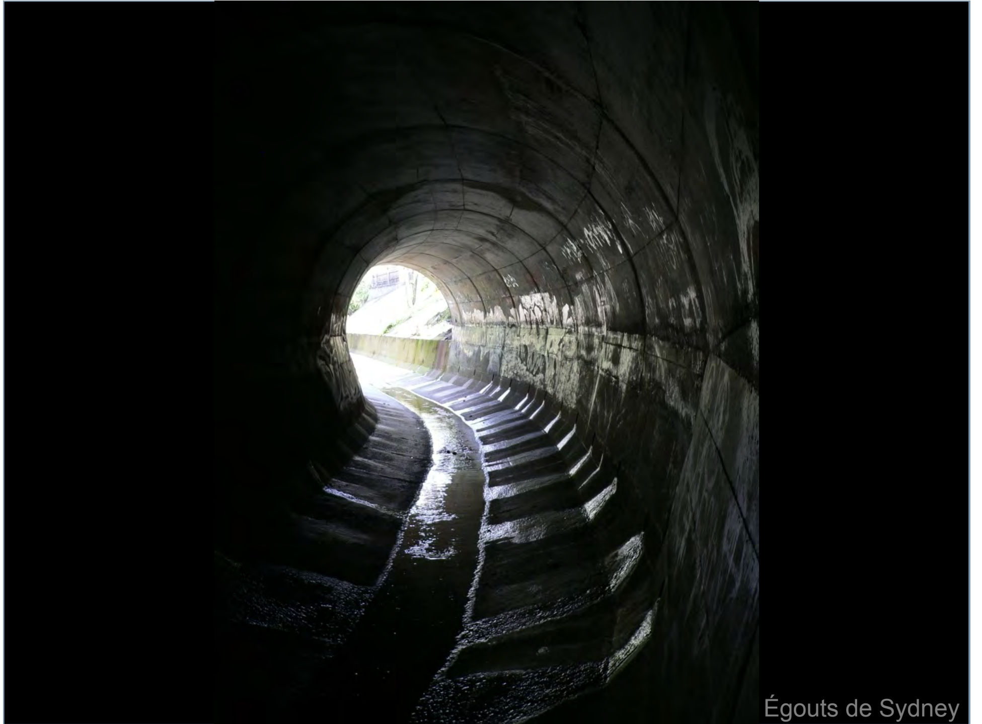
Égouts de Sydney