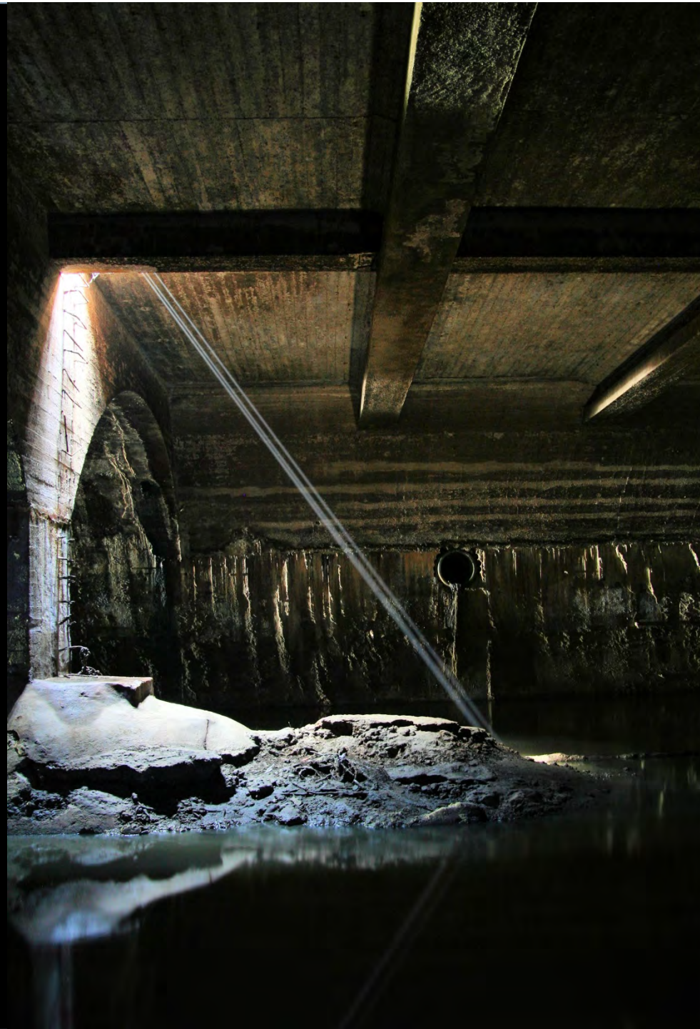
Égouts de Bruxelles