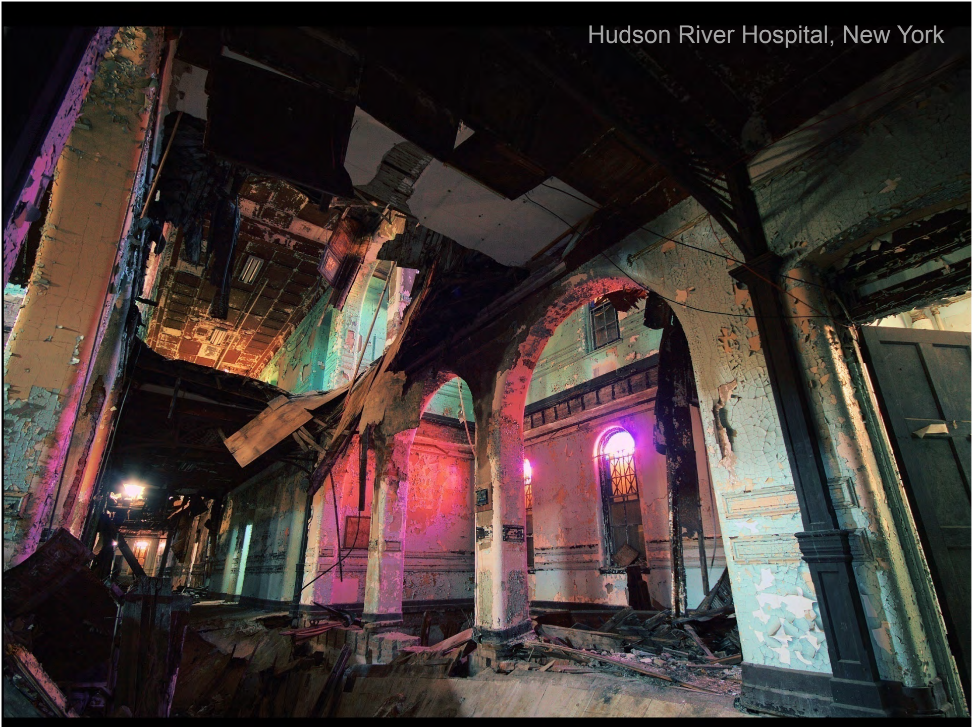
Hudson River Hospital, New York