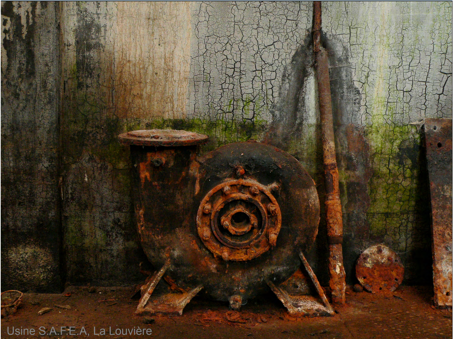
Usine S.A.F.E.A, La Louvière