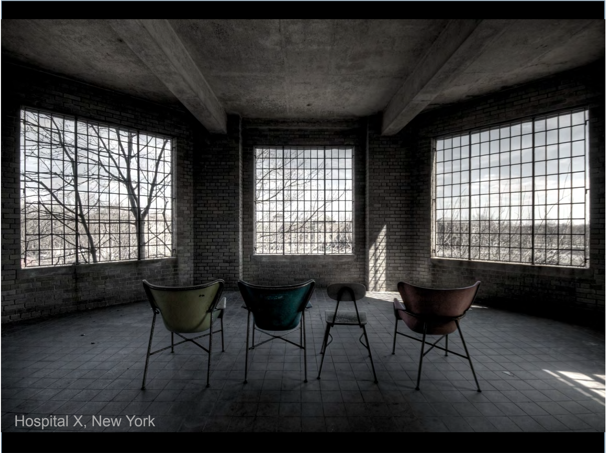
Hospital X, New York