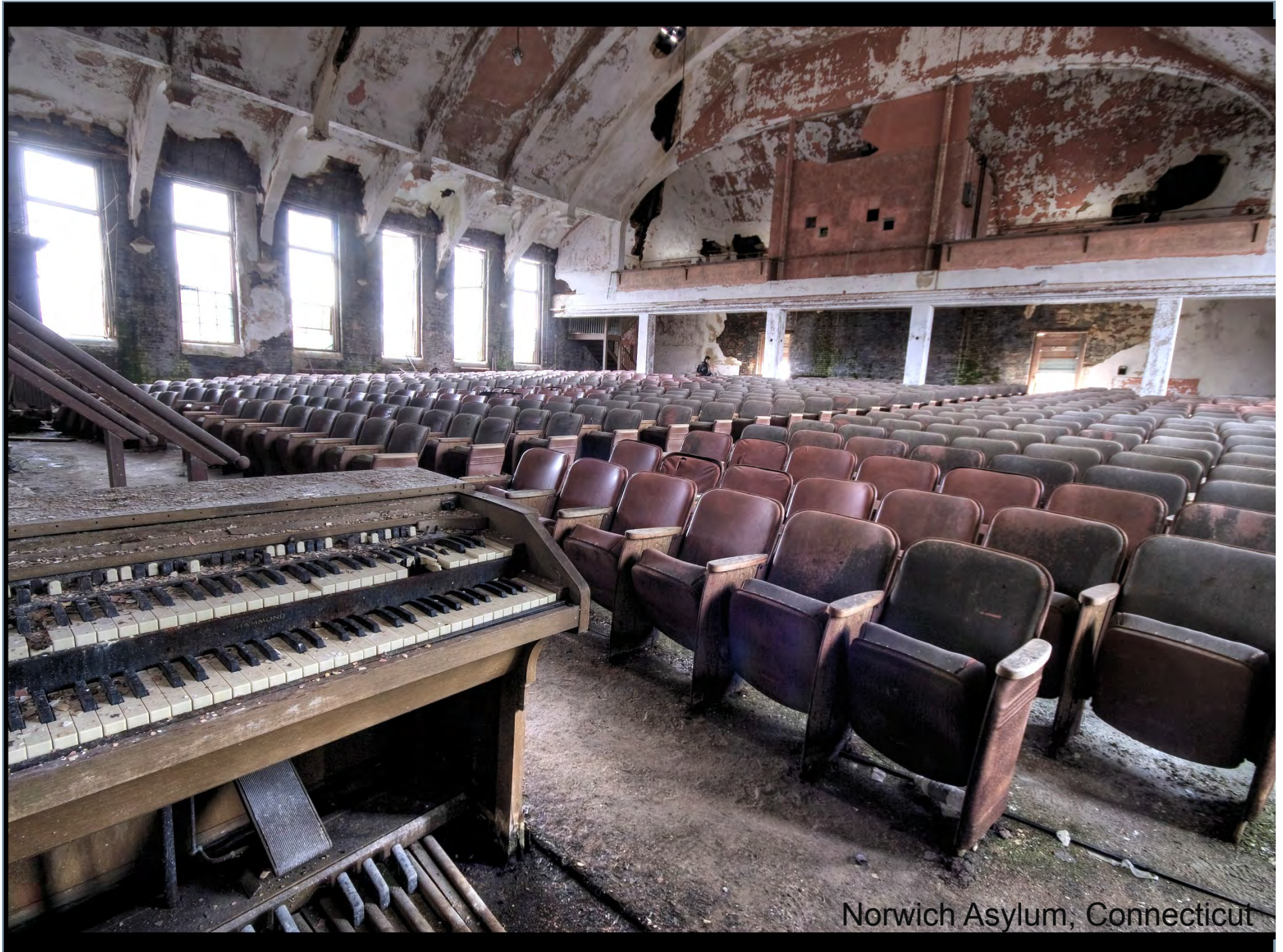
Norwich Asylum, Connecticut