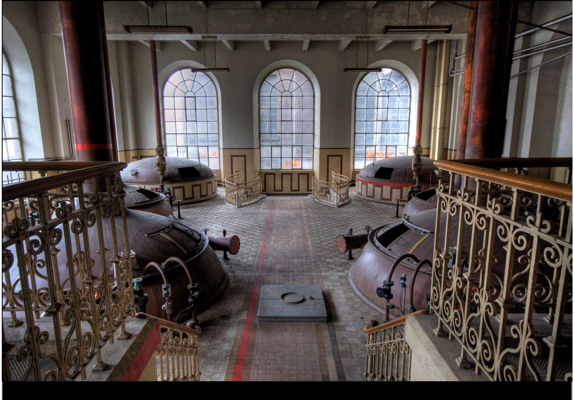
Ancienne Brasserie Stella-Artois, Leuven