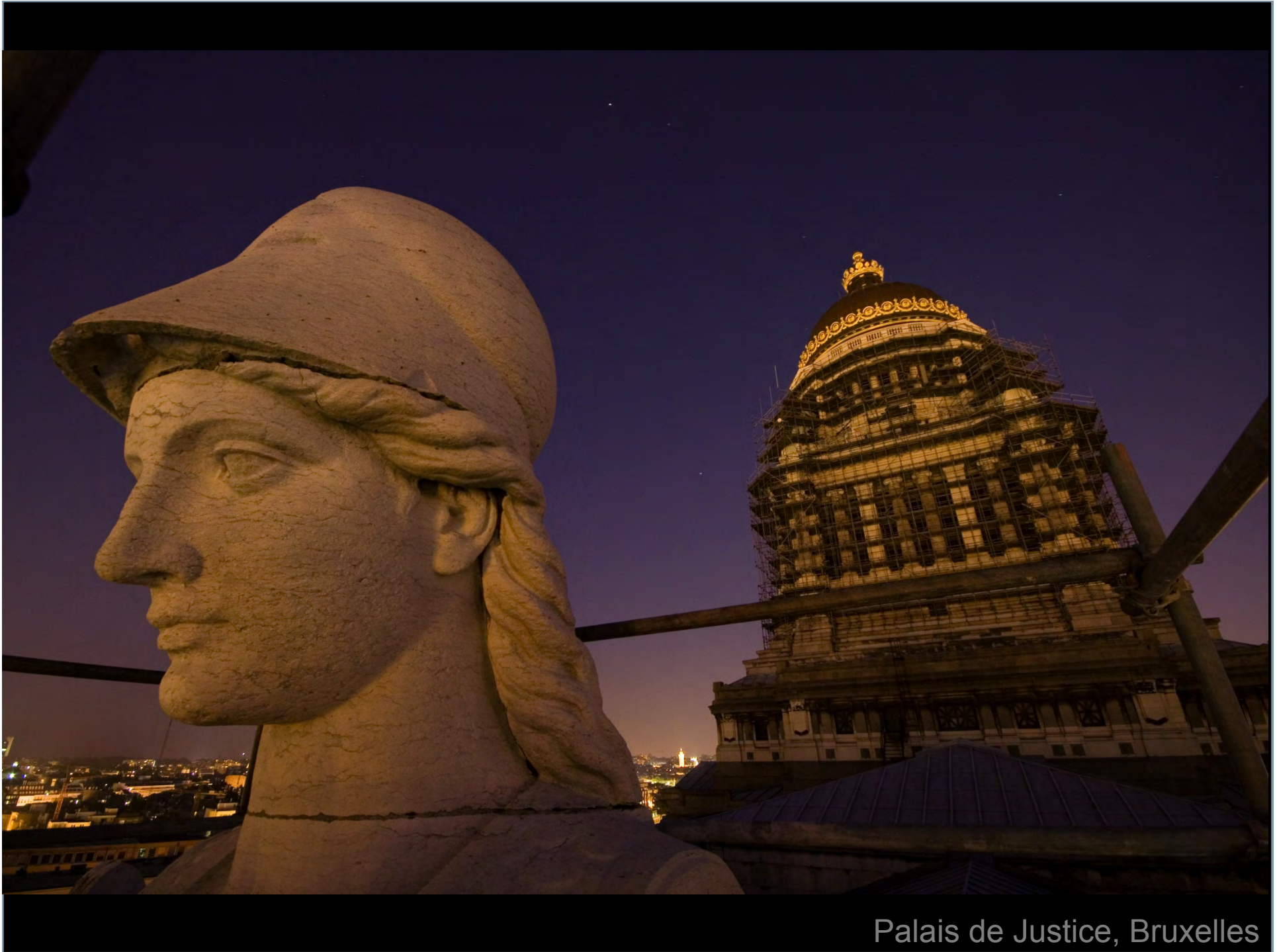
Palais de Justice, Bruxelles