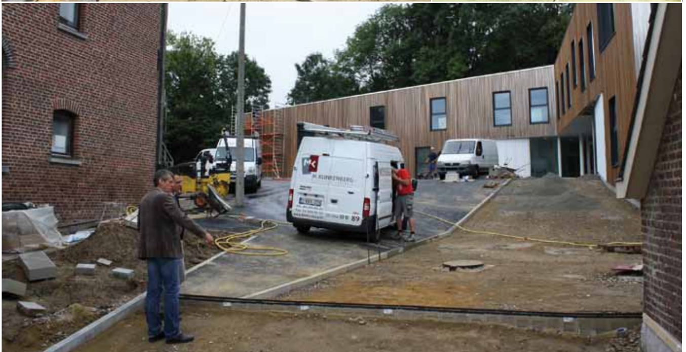
Le nouveau bâtiment remplace des préfabriqués installés depuis trente ans. Son architecture est en rupture avec les bâtiments historiques de l'école.