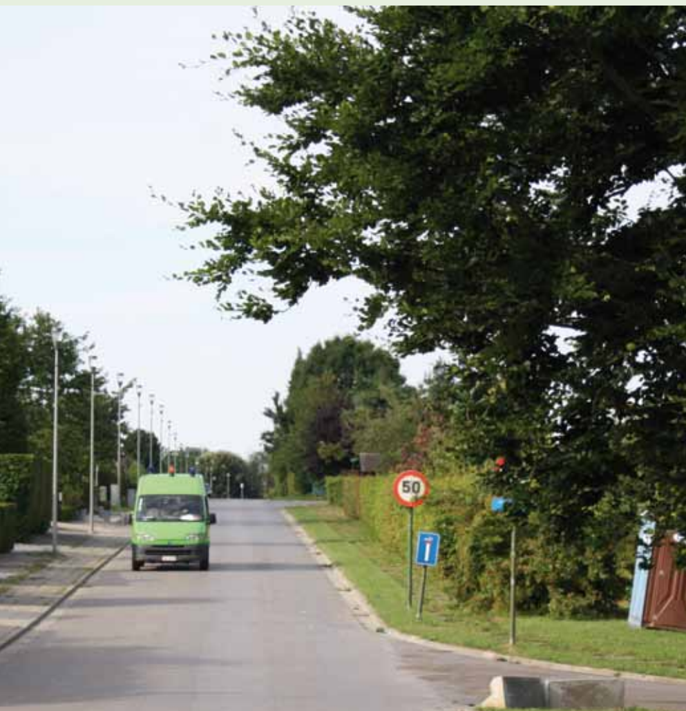
clairage intelligent. Les lampes s'allument ou s'éteignent en fonction de la présence des automobilistes ou piétons.