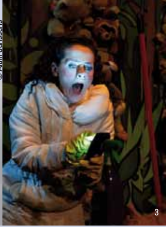
1) Le Stampia, 2) La rentrée d'Arlette, 3) Baraque foraine