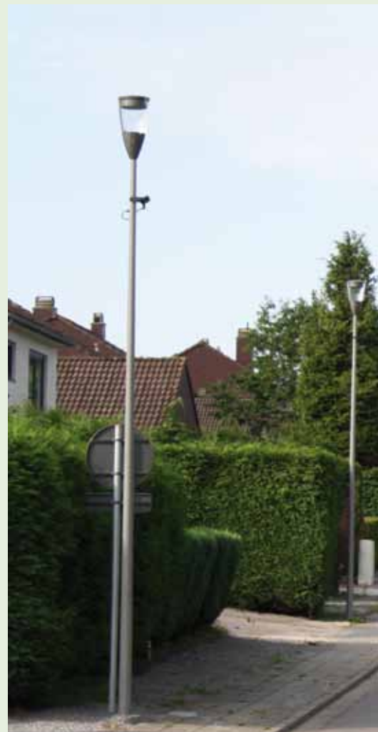
À Limal, tout un quartier dispose désormais d'un éco

Non, aucune. Dans la pratique, les villes