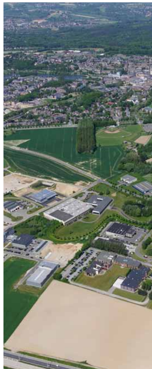
Parmi les mesures prises par le gouvernement figure notamment la cr