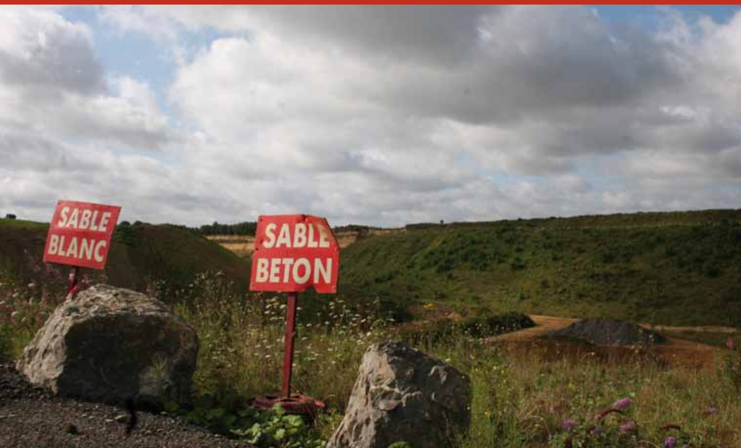
L'entreprise Hoslet, spécialisée dans l'extraction de sable, et ses 600 camions qui traversent quotidiennement Chaumont-Gistoux cause d'indéniables problèmes de mobilité dans le centre de l'entité.