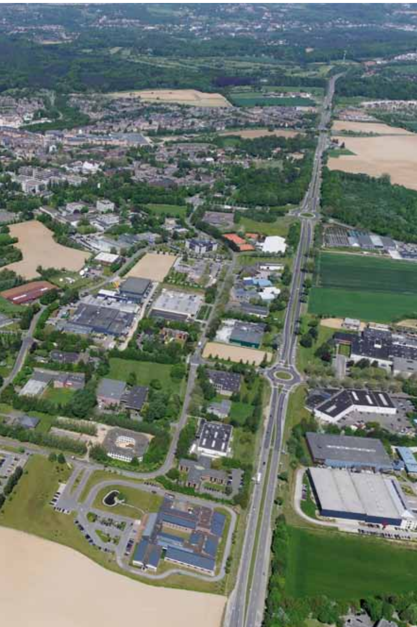
Créations de zonings industriels.