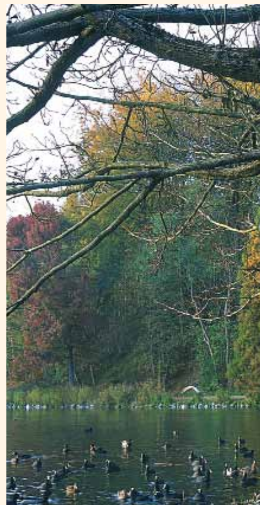
Le domaine Solvay, à La Hulpe, au