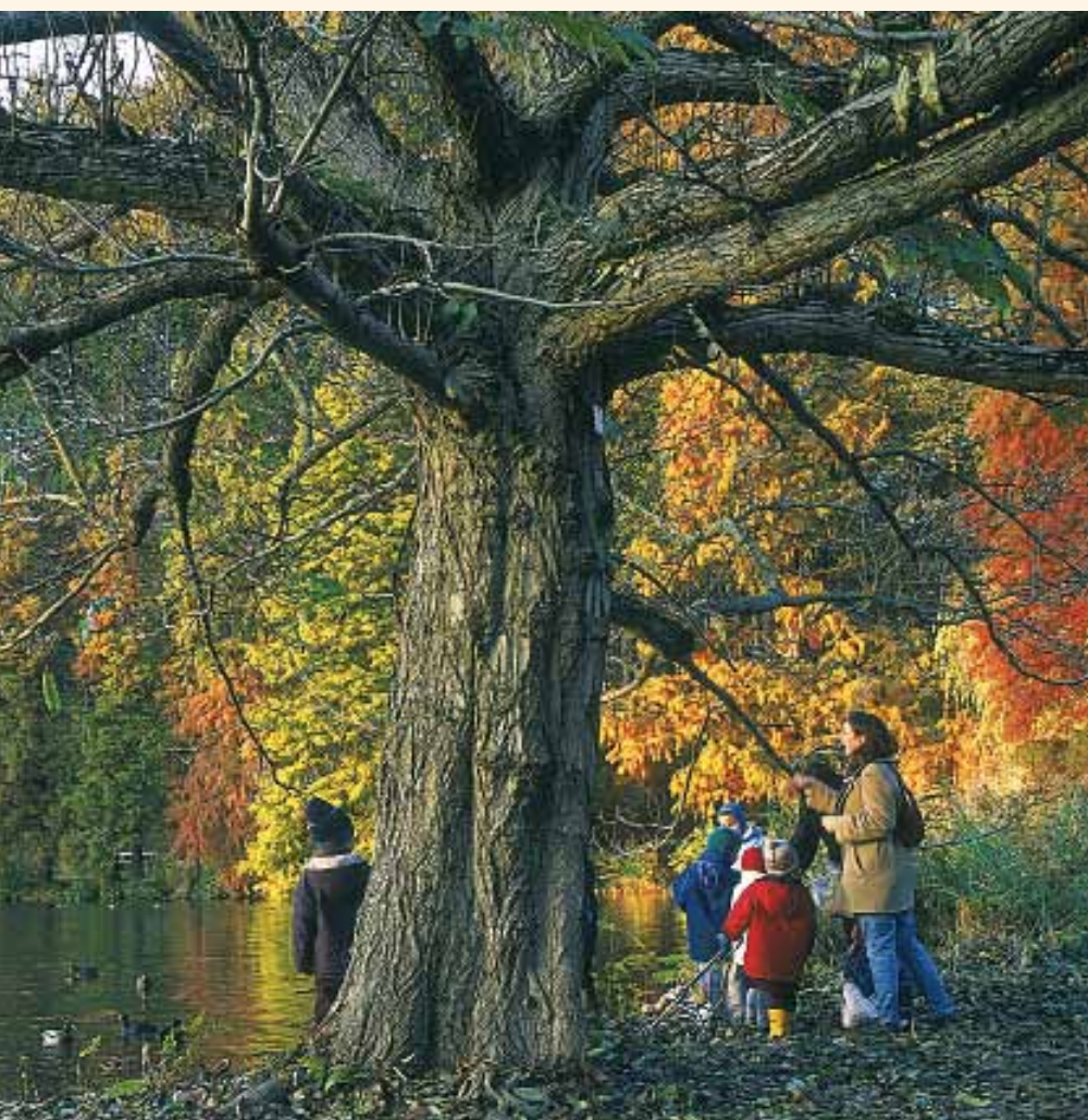
neille une série d'arbres remarquables, dont ce Ptérocaryes du Caucase situé au bord d'un des étangs.